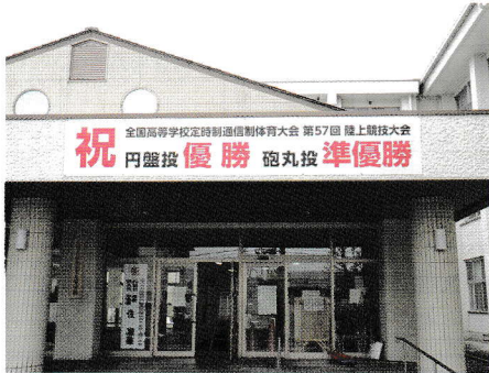
同窓会母校援助費で設置