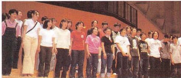
▲全日制H11合唱コンクール