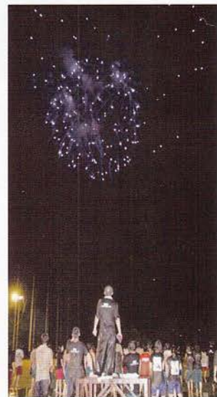
▲全日制H16くれき野祭