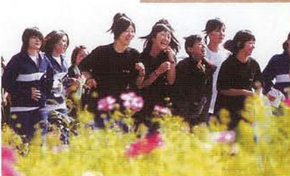
▼定時制H20新入生歓迎会